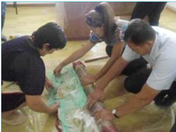
Изготовление панно - текемета

района Кызылординской области и Администрацией заповедника Барсакельмес.