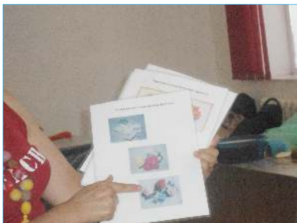
Занятие о композициях и дизайне войлочных изделий

Первый пилотный тренинг, приуроченный к международной конференции, посвященной 75-летию заповедника Барсакельмес, прошел в виде отдельной сессии в г.Аральске с 9 по 11 сентября 2014 г.