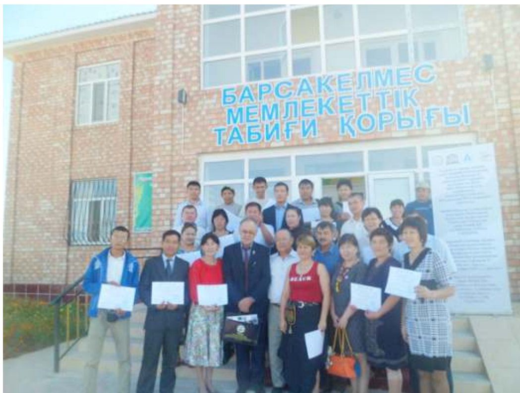
Фото на память 11 сентября 2014 г., г. Аральск

Проведенный тренинг совместными усилиями ИД МФСА в РК и Кластерным Бюро ЮНЕСКО в Алматы при поддержке Акимата Кызылординской области и Администрации заповедника Барсакельмес, явился успешным стартом для продолжения проведения подобных тренингов в целях повышения осведомленности местного населения о сохранении биоразнообразия родного края через развитие ремесленничества. Такой подход отвечает, как было отмечено выше, развитию туристического кластера, а также будет способствовать повышению занятости местного населения альтернативными, рыболовству и охоте, видами деятельности, что позволяет, в определенной степени, сохранить возрождающееся в казахстанской части Приаралья биологическое разнообразие.