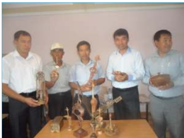
Слушатели изучают традиционные виды и способы резьбы по дереву

Тренеры, согласно разработанных рабочих программ мероприятия, подготовили презентационные материалы, провели базовое тестирование слушателей на знание предмета и владение соответствующими навыками. Ими были прове-