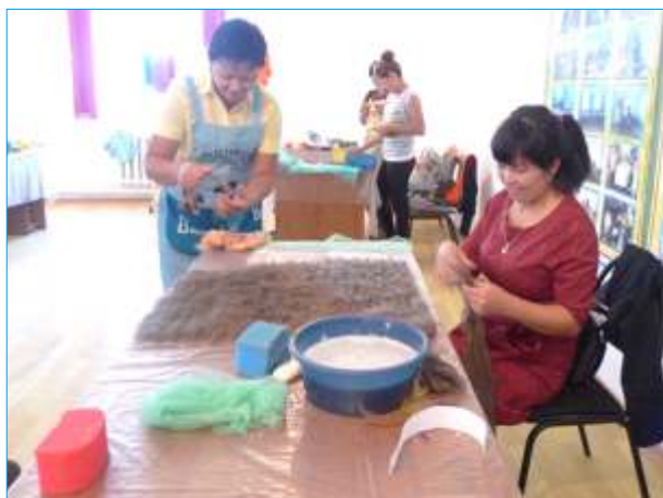
Работа в группах

озер, а также акватории Малого Арала, флора и фауна которых восстанавливаются после строительства Кокаральской дамбы.