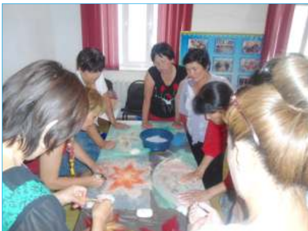
Тестирование приобретенных навыков

целью обеспечения, альтернативных рыболовству и охоте, видов занятости, а также пропаганды сохранения биоразнообразия заповедника Барсакельмес, Рамсарских водоно-болотных угодий дельты Сырдарьи и системы дельтовых